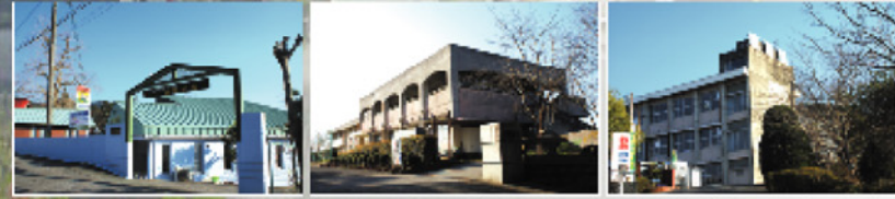
電野保育園(600m) 龍野小学校(800m) 甲佐中学校(約1.2km)

[物件概要] ■住所/上益城郡甲佐町大字下横田字中川原 ■交通/熊本バス浅井入口バス停徒歩1分 ■開発許可/熊本県指令上益城農建第21号 ■開発許可日/平成15年3月10日 ■開発総面積/36,895㎡ ■宅地総面積/25,668.67㎡ ■販売総区画数/106区画 ■今回販売区画数/30区画 ■区画面積/229.08㎡~292.95㎡ ■土地販売価格/396万円~577万円 ■地目/雑種地(現況宅地) ■道路/9m~2m舗装道路 ■建ぺい率/70% ■容積率/140% ■電気/九州電力 ■ガス/LPGガス(個別) ■上水道/町水道 ■排水/合併浄化槽(別途費用) ■雨水/地下浸透槽(事業主支給) ■売主/三栄商事株式会社 ■広告有効期限/平成22年8月末日