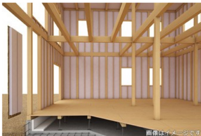
画像はイメージです ▲構造のイメージ

フィアスホームは、夏涼しく冬暖かい気密・断熱性に優れた「閉じる技術」、風・光といった自然エネルギーを活用した「開ける技術」に加え、「太陽光発電システム」で住宅に必要な電気を発電する技術を組み合わせることで、さらなるエコロジ—な暮らしを提案する住宅です。